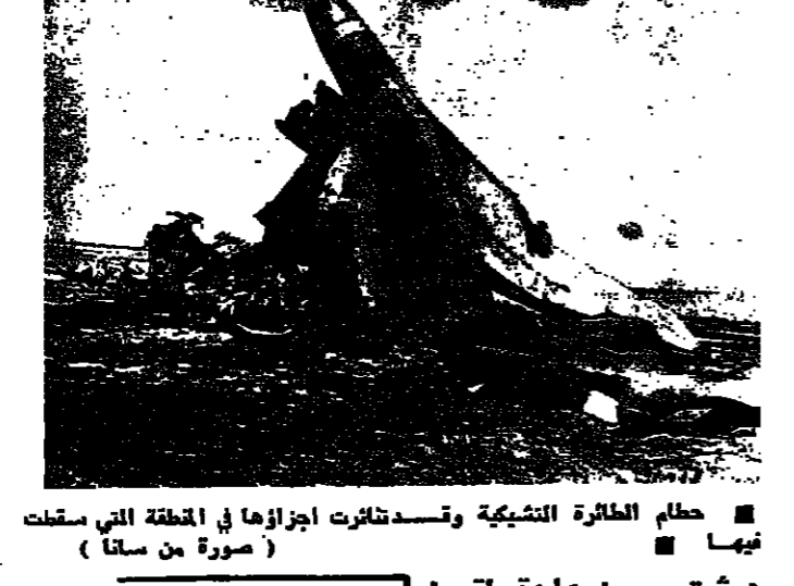
حطام الطائرة التشيكية وتصدتارت اجزاها في المنطقة التي سقطت فيها

مقتل ١٢٦ شخصاً بسقوط طائرة تشيكية قرب دمشق